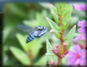
ブルービートルに会えるかも